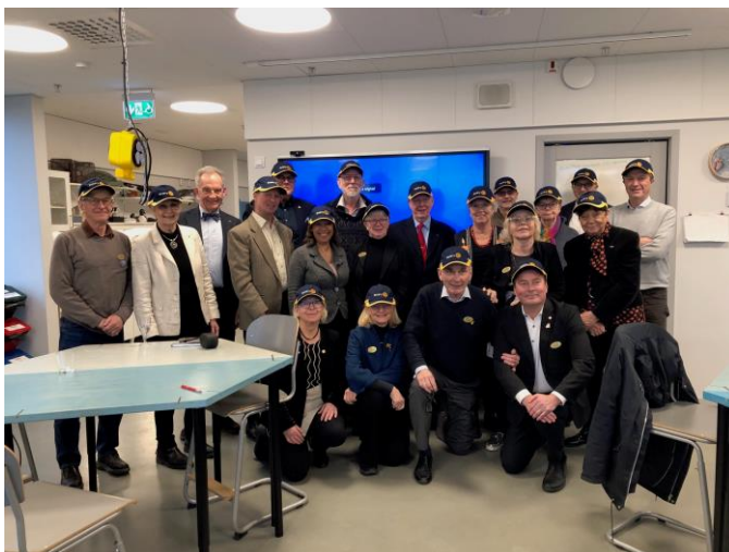
Promoveringen av 20 nya Rotary Östersjöambassadörer på Baltic Sea Science Center på Skansen den 23 februari